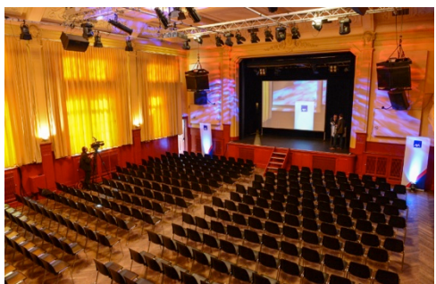
Seminare & Kongresse Bestuhlte Anlässe bis 440 Personen

Haben Sie andere Bedürfnisse und Wünsche? Wir haben uns erfolgreich zum Ziel gesetzt, auf jeden Kundenanlass individuell einzugehen und ei dazu passendes und persönliches Programm zu gestalten.