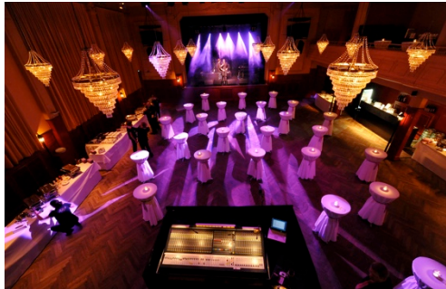
Stehapéros bis 600 Personen mit Stehtischen