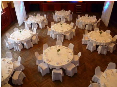
Gala- Dinner mit runden Tischen 130 Personen mit 10er Tischen