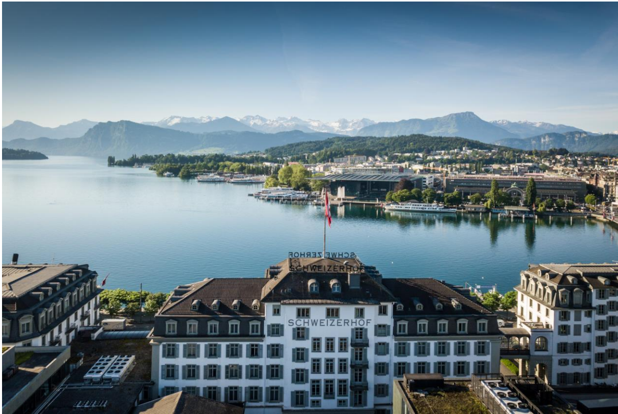
Aussicht auf den Vierwaldstättersee und den Pilatus