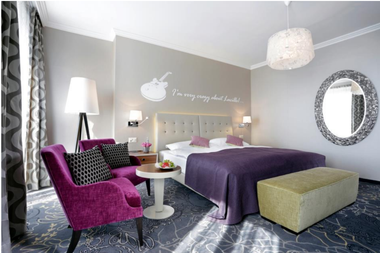
Preisgekröntes Deluxe Doppelzimmer