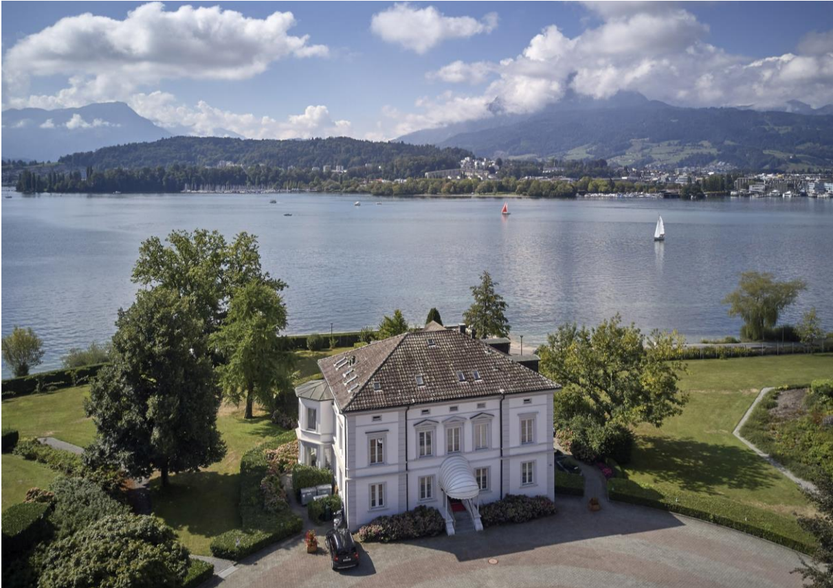
Die VILLA Schweizerhof an unvergleichbarer Lage