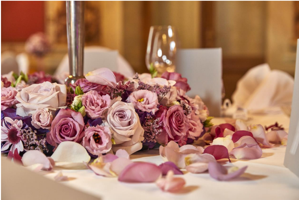
Blumendekoration unserer hauseigenen Floristin